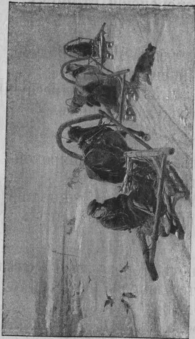
Что здѣсь нарисовано?

Отъ мороза ихъ Брови, бороды Поросли густымъ Бѣлымъ инеемъ.