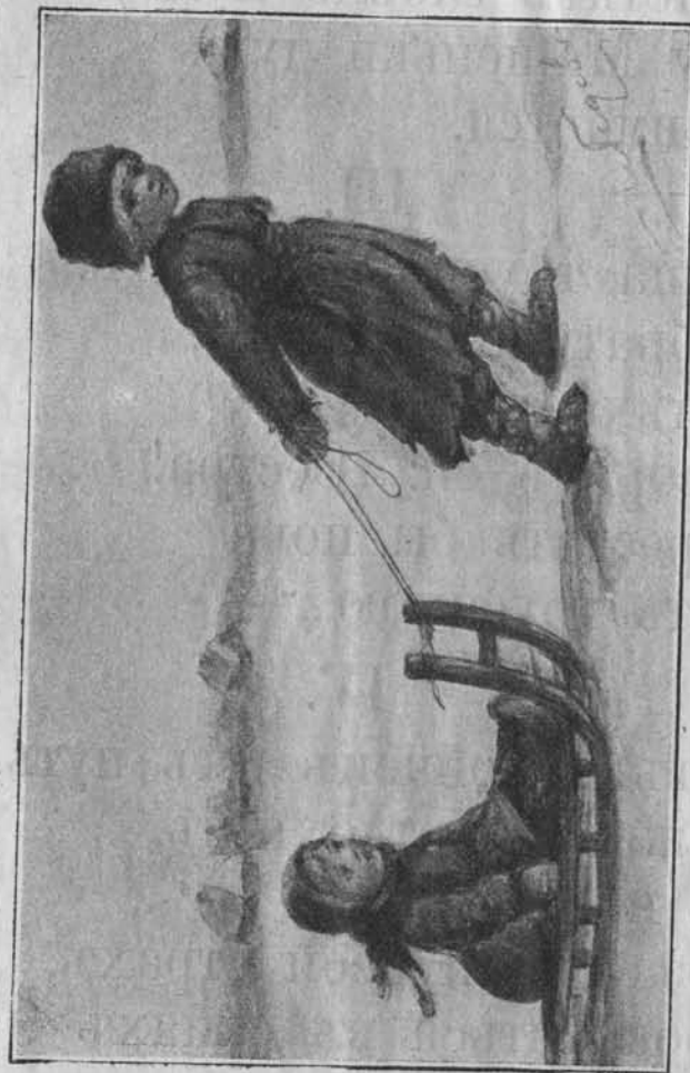
Что здѣсь нарисовано?

Всѣ хохочуть, шумять. Маша съ братцемъ сидятъ На салазочкахъ.