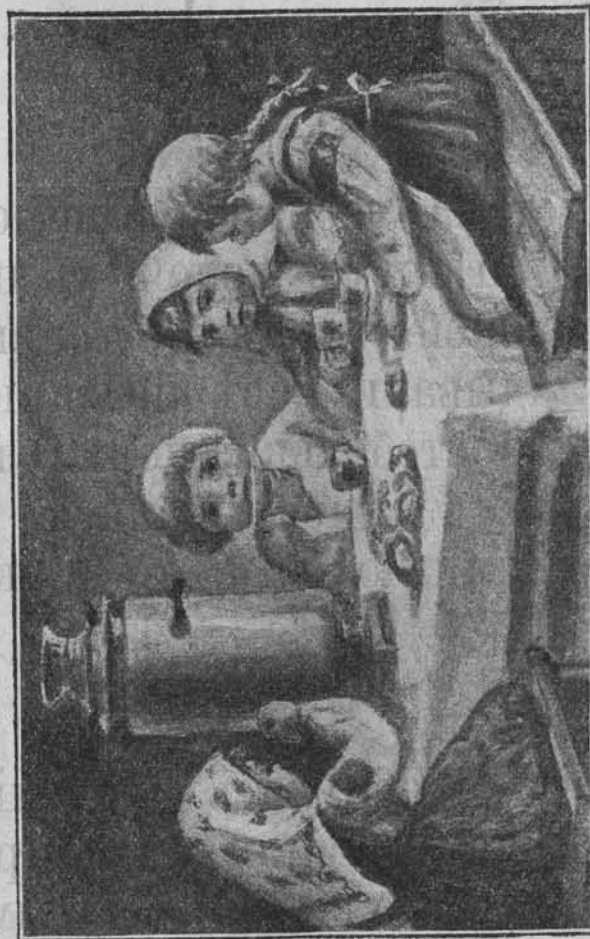
Таня и ея гости.