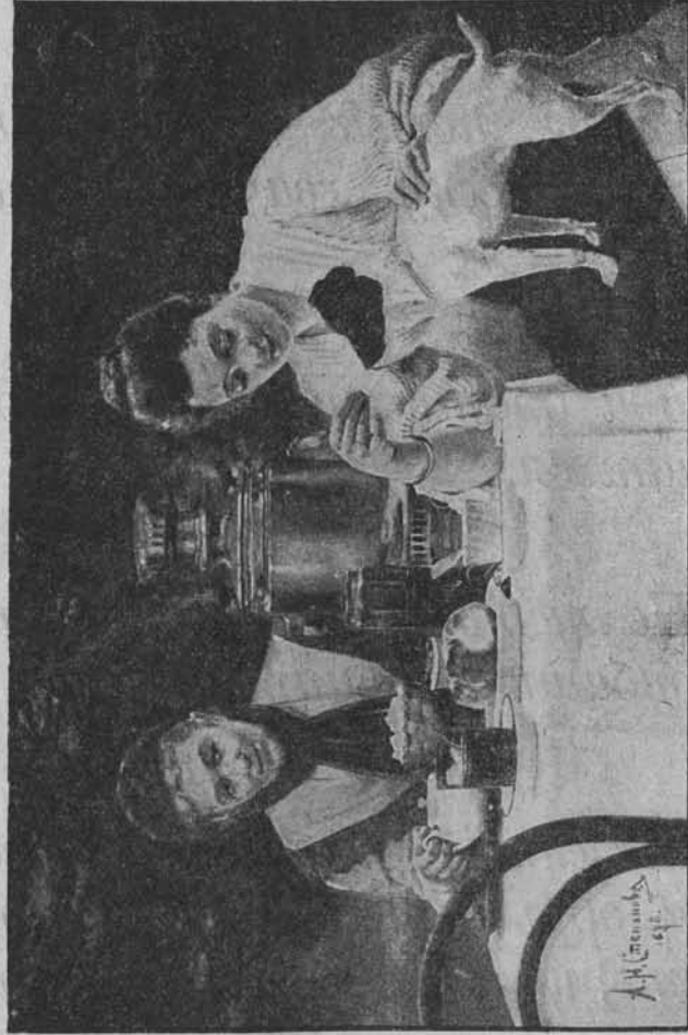
Разскажете, что нарисовано на этой картинкѣ.