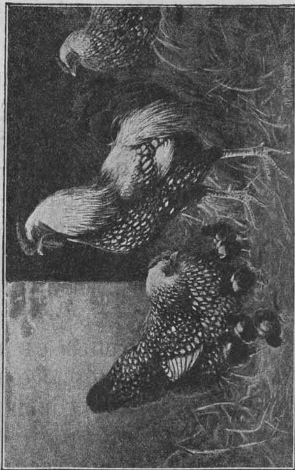
Разскажите, что здѣсь нарисовано.

Утромъ, только что заря стала заниматься, пѣтухъ и закричалъ: ку-ку-ре-ку! Услыхала пѣтуха лиса; захотѣлось ей пѣтушьимъ мясомъ пола-