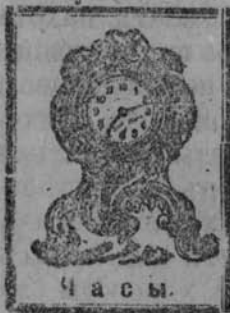
Ч а с ы.

Рѣжь ножемъ этотъ бѣлый хлѣбъ. Лебяжья перина изъ лебяжьяго пуха. Рыжій быкъ жуеъ жвачку. Колосья желтѣють на нивѣ. Ежи живутъ у насъ въ саду. Челнокъ плывеъ по рѣкѣ. Что тебѣ надо? Волчьи глаза зорки.